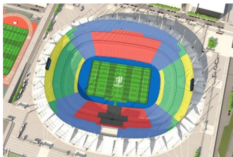
サン=ドニ スタッド・ド・フランス