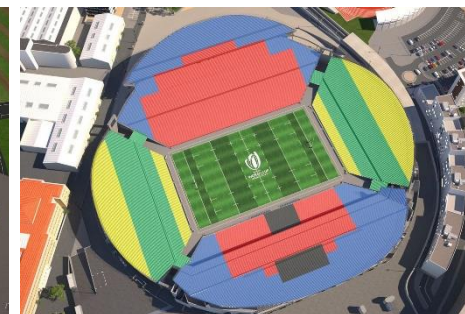
マルセイユ スタッド・ヴェロドローム