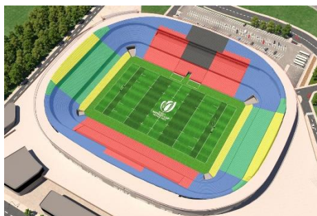
ニース スタッド・ド・ニース