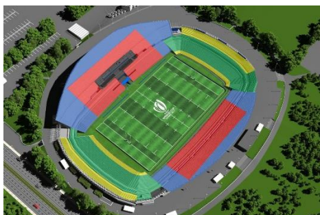
ナント スタッド・ド・ラ・ボージュワール